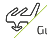
ISOL PLUS G2